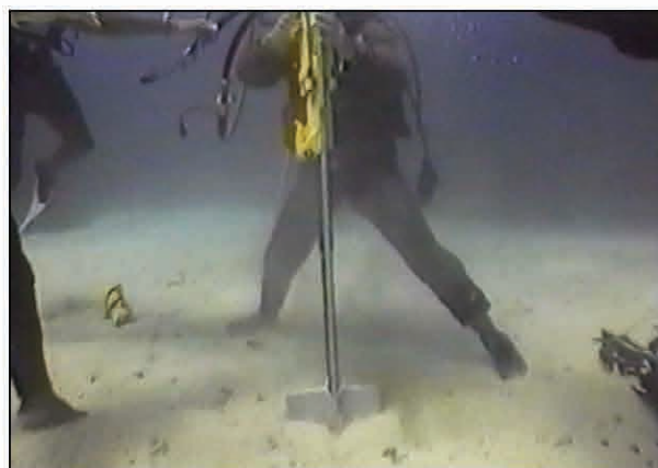
Ancora este impinsa in pamant.