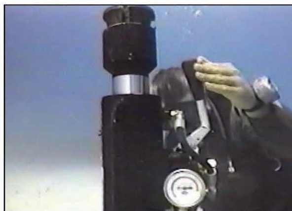
Ancora este trasa si "rotita/basculata" in sol neperturbat/neafanat.