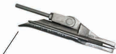
Buza in forma de " Duckbill "

Forma " Duckbill " pe muchiile din spate ale ancorei o ajuta sa se roteasca in pozitia blocat prin infigerea in sol nedisturbat/neafanat atunci cand tirantul de ancorare este tras in sus de blocatorul de ancora.